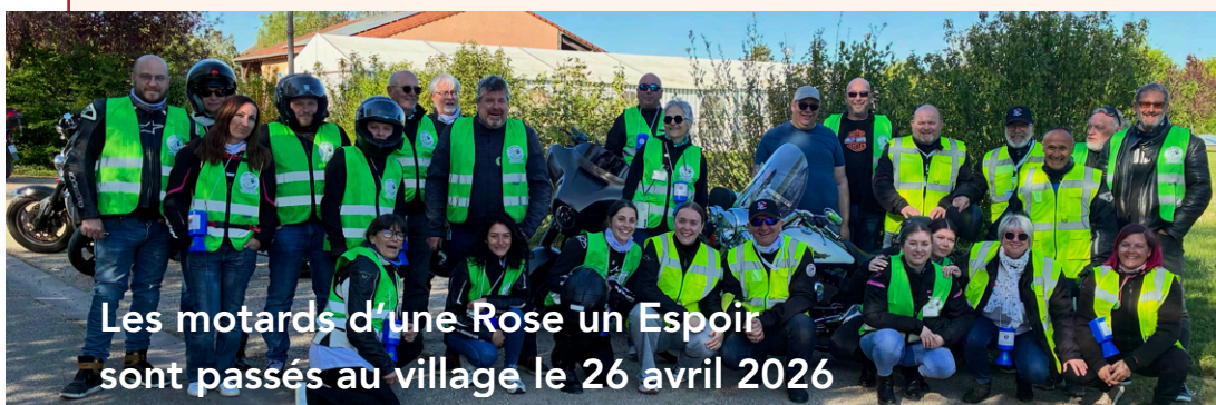
Les motards d'une Rose un Espoir sont passés au village le 26 avril 2026

À compter de la semaine n°30 21, 28 JUILLET 4, 18, 25 AOUT