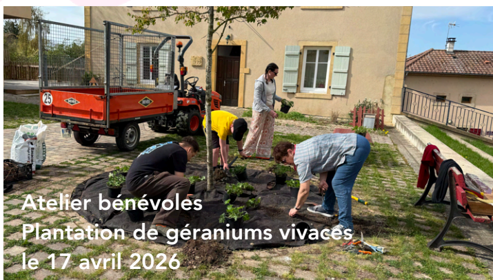
Atelier bénévoles Plantation de géraniums vivaces le 17 avril 2026