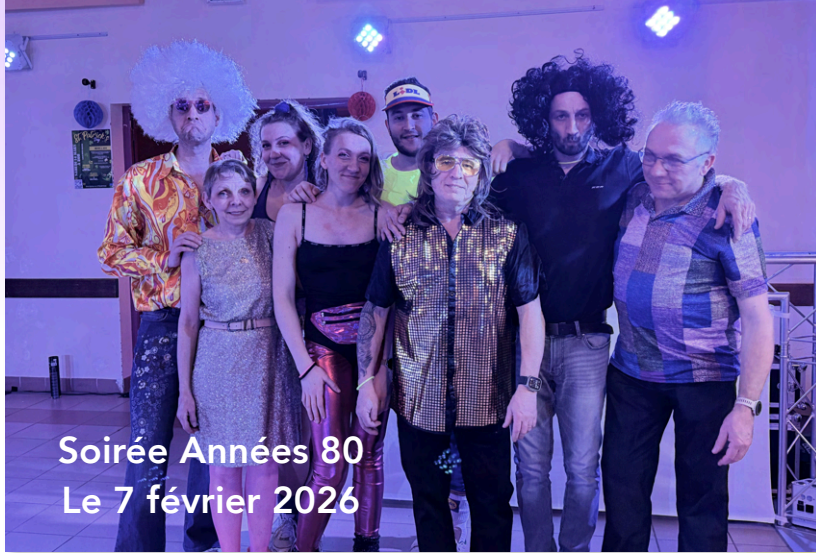
Soirée Années 80 Le 7 février 2026