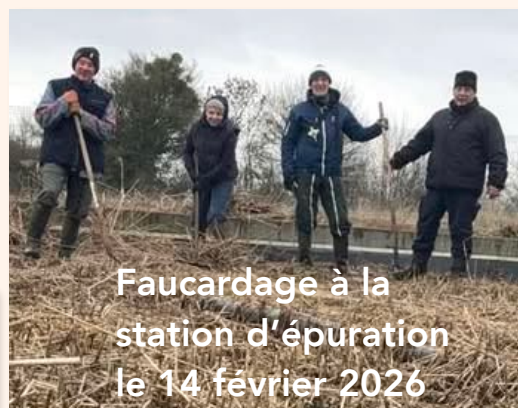
Faucardage à la station d'épuration le 14 février 2026