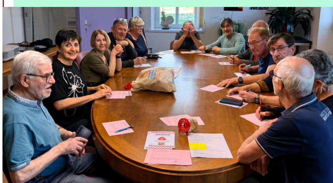
Réunion d'informations le 17 avril contre la prolifération des frelons asiatiques et distribution des pièges offerts par la OLC.