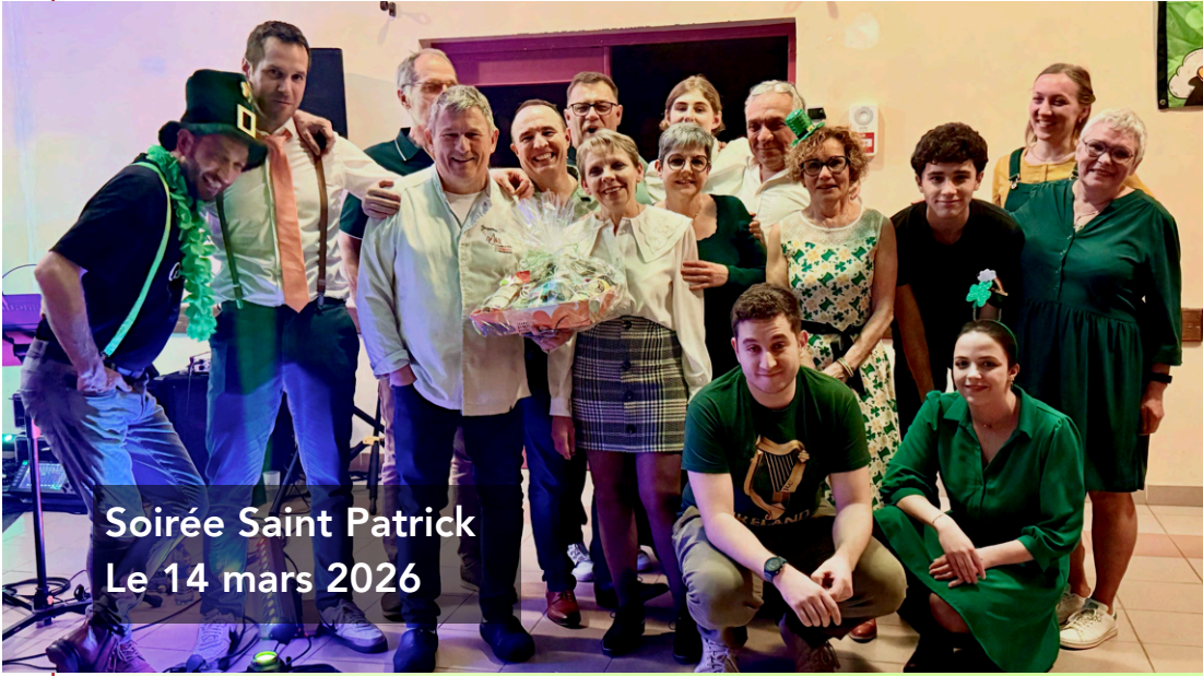
Soirée Saint Patrick Le 14 mars 2026